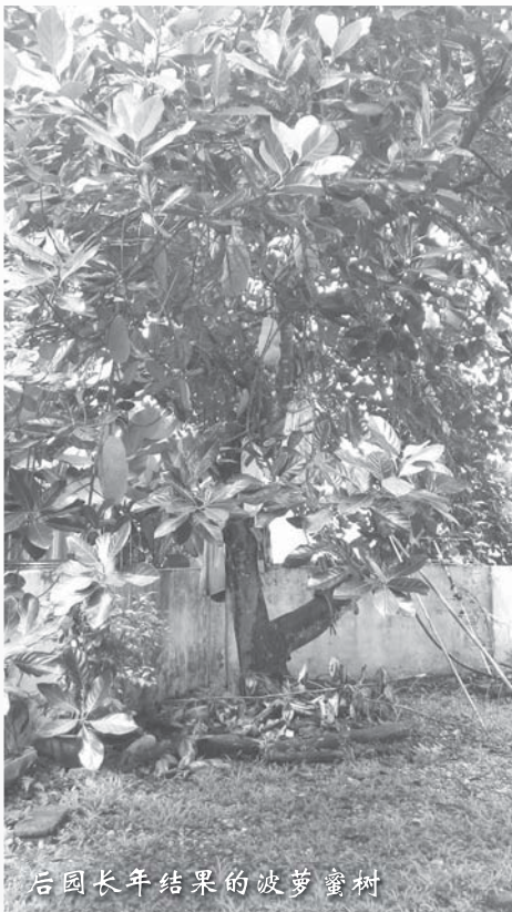
后园长年结果的菠萝蜜树