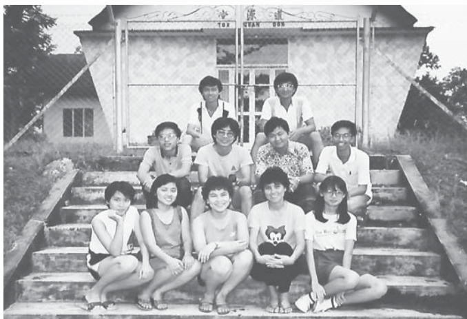
80年代青团契友在诗巫道源堂留影

听完牧师的信息和祝祷，领会宣布“默祷”后，新一轮的团契时光接着开始。留下的契友，一些席地而坐，一群挤上秋千开始高谈阔论，直到牧师下“逐客令”。记得黄朝邦牧师会脸带微笑，慢步走来用福州说：兄弟姐妹，可以回家“睏眠”了，明天要来做礼拜哦。走出教堂篱笆门，牧师就随手把门锁上。