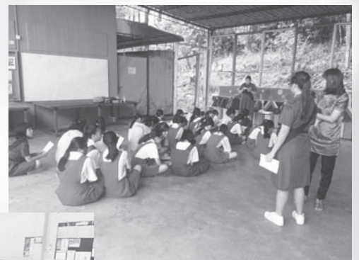
SMK Pending ↑