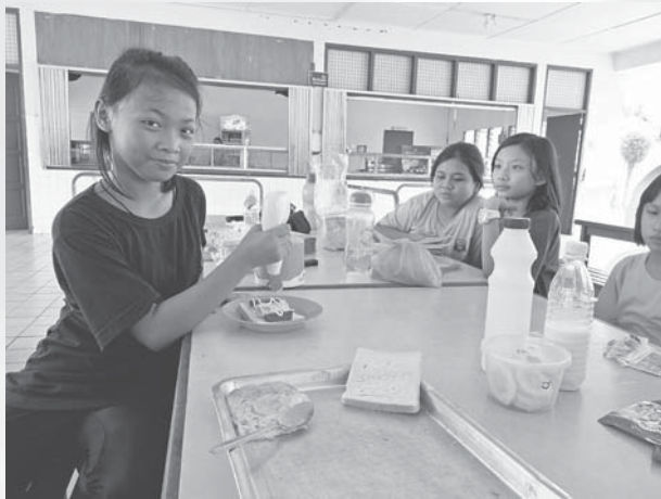
SJK Sg. Apong