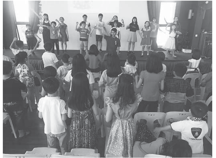
主日学 - 聚会时光

五年级的下半年，主日学规定所有的五年级学生都要上儿童三福，主题为“儿童的希望”。我非常感谢我的儿童三福老师，她们让我更加深入的了解福音对世人的重要，同时也让我懂得如何传福音给我们身边的人，让更多的人认识主耶稣。上完儿童三福课程，我们便要“出队”去传福音，虽然都是老师的安排和带领，但这也让我从中学