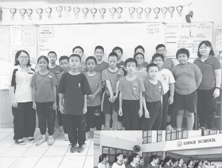
↑ SJK (C) Bintawa