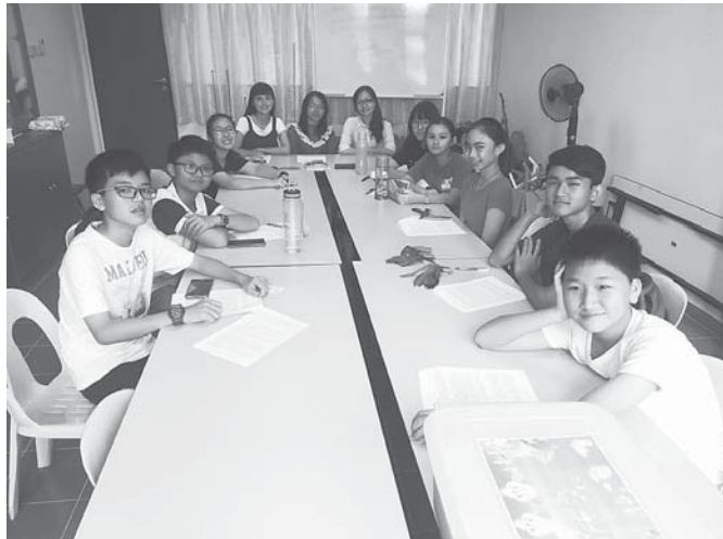
主日学 - 上课