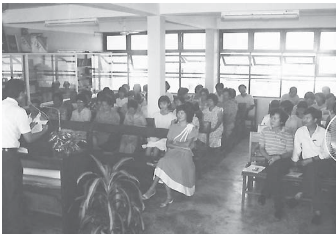
1986年青团聚会所聚会

意犹未尽的我们，一路上哼着诗歌，脑海中已在盘算要去哪里吃夜宵。〈肯雅兰园〉马路旁的“茄汁粿条”，“豆芽面”，“哥罗面”和〈诏安路〉旁的“粿杂”是我们最向往的美食。大快朵颐后，才意兴阑珊的坐“顺风车”回家。