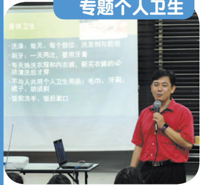
5月20日 · 专题个人卫生