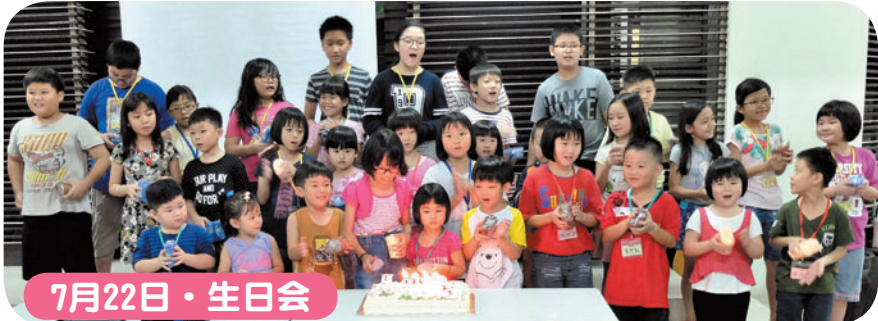
7月22日 · 生日会