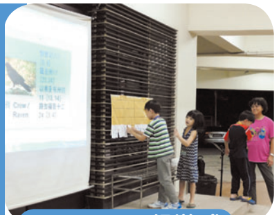
5月6日 · 圣经游戏