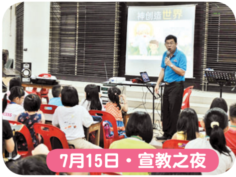
7月15日 · 宣教之夜