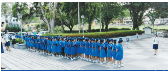
Junior, Senior and Pioneer 列队