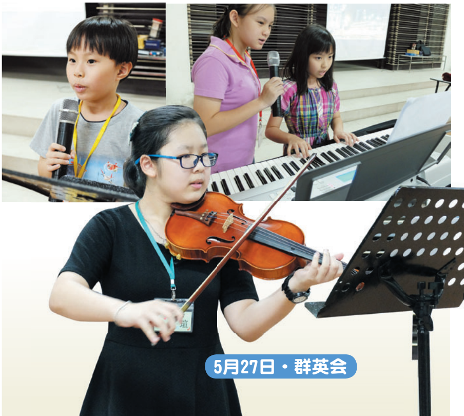
5月27日 · 群英会