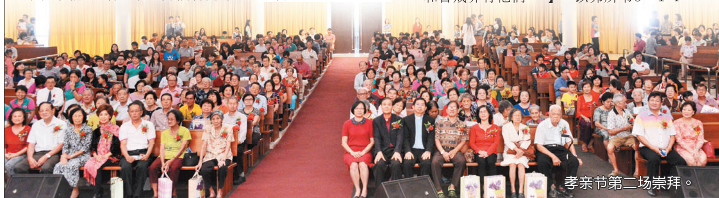
孝亲节第二场崇拜。

牧师最后呼吁，父母对我们的期待，就是作儿女的能让他们如愿就是尽孝。我们都会慢慢变老，趁现在还能孝顺，就请尽心尽力吧！