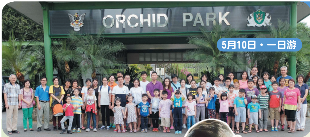
5月10日 · 一日游