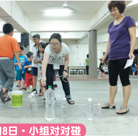
7月8日 · 小组对对碰