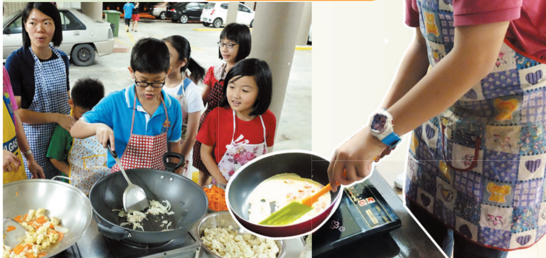
6月17日 · 我是小厨师