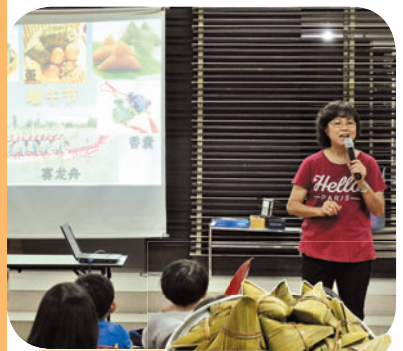
6月3日 · 端午节的由来