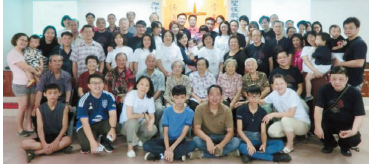
→ 陈师母家庭退休会合照