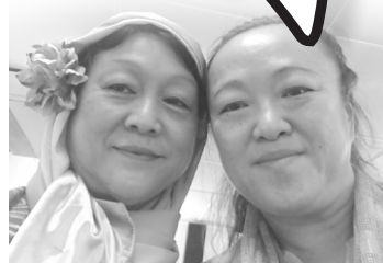
▲雪珠与敏华姐妹们在节目上的造型。

藉着撒马利亚妇人的故事，道出耶稣是活水—赐生命的活水，耶稣的活水是甜的，喝了还想再喝，要有生命内容，结出许多好果子，一起分享好果子的生命。