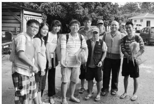
▲ C队组员集合在Nanga Enthabai码头前合影。