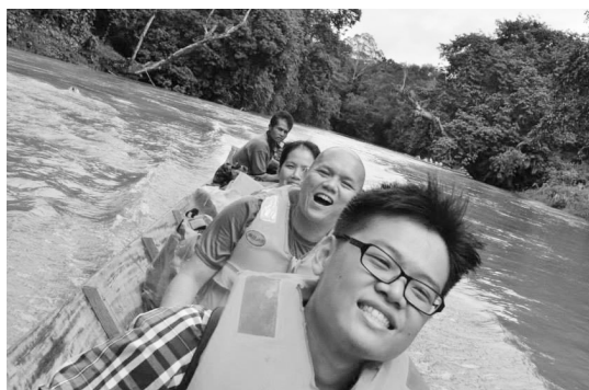
▲ 一行人乘舟前往Nanga Enthabai的水路上。