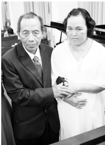
↑Paling lama pasangan yang telah berkahwin (33 tahun)

Puncak kem suami-isteri adalah kebaktian Penyegaran Perkahwinan. Satu pasangan demi satu pasangan memegang tangan sambil memasuki bait suci, berjanji dan berkomit dihadapan Tuhan. Kem Suami-isteri diakhiri dengan ceramah “Keluarga Bahagia” kunci utama keluarga yang bahagia adalah suami-isteri mempunyai satu hati yang mahu dekat dengan Tuhan. Para peserta berharap gereja dapat mengadakan lagi kem sebegini untuk pasangan yang tidak beserta pada kali ini.