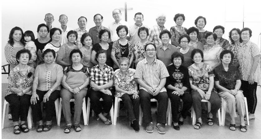
▲ 乐龄团契契友与牧师在第一次聚会上合影。