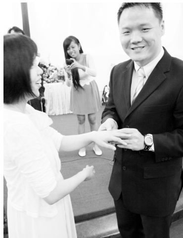
↑Hadiah kasih sayang