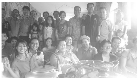
▲ D队组员们在居民家与他们合影。