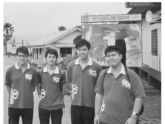
▲一行人在戒毒所门前合影。