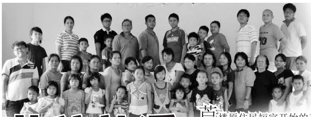
←C队组员在Rh Sang的教会与居民们合影。